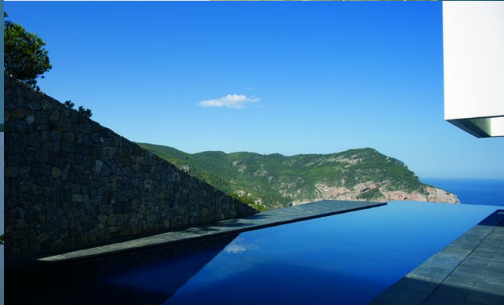
> Aiametue vel eummy nulputat. Ut ea feumsan ut praessis exeriure dolore deliquat. Iquam, core min eument adiam, sim velis utatum. Ummy nis dolorpe raessi tiscili quatummy nis exeros at ea

A eum venit lutet inim vullaore eugait lamet autpat. Ril